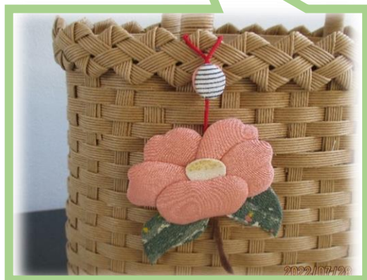
椿の花 縦7cm 横7cm(ストラップ含まず)